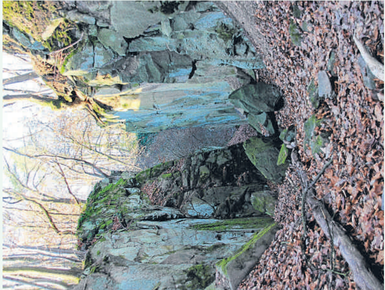
Schlucht am Stenzelberg

Wo? Nordwestliche Anhöhe des sogenannten Dreiergipfels, der von Himmerich, Mittelberg und Brödersberg gebildet wird. Westlich des Rheins zwischen der Bad Honner Aegidienberg gelegen. GPS: N 50° 38.590 E 007° 16.376