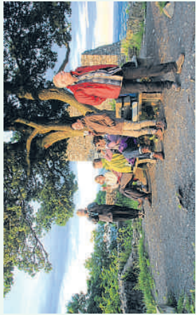
Sonnenuntergang auf der Löwenburg